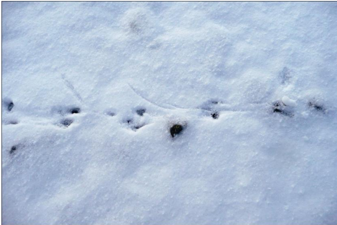
Mynd 1. Rottuspor sóust í kavanum tíðliga ein morgun í februar 2010 í Nólsoy.

týdning í fyrirbygging av rottu og øðrum skaðadjórum. Sjálvst um kommunur hava aktingarmann, ið er til at heita á, so hevur tað stóran týdning, at fólk venda sær til rætta viðkomandi við upplýsingum, um nakrar ábendingar um rottu síggjast í oygni.