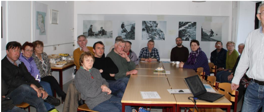
Mynd 3 Fyrsti borgarafundur í skúlanum í Skúvoy var tann 22. apríl 2015.

Avgjørt varð, at aðrir áhugapartar eftir tørvi skulu takast við í arbeiðið. Nevndin hevur skipað fyri almennum fundum, t.d. var borgarafundur í skúlanum í Skúvoy 22. apríl 2015, har kunnað varð um Ramsar og um ætlanina at gera Ramsar-ætlan fyri Skúvoy. Umframt nevndina møttu eini 12 fólk á fundi. Aftaná almennu høyringina í des. 15/jan. 16, varð endaliga uppskotið til Ramsar-ætlan fyri Skúvoy lagt fram á nýggjum borgarafundi tann 17. mars 2016.