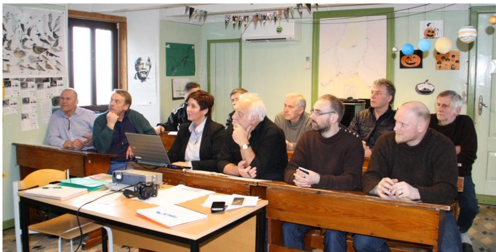
Mynd 4 Fyrsti borgarafundur í skúlanum í Mykinesi var tann 10. apríl 2015.

Avgjørt varð, at aðrir áhugapartar eftir tørvi skulu takast við í arbeiðið. Nevndin hevur skipað fyri almennum fundum. Tann 10. apríl 2015 var borgarafundur í skúlanum í Mykinesi, har kunnað var um Ramsar-og um ætlanina at gera Ramsar-ætlan fyri Mykines. Mest sum øll bygdin og fólk við tilknýti til Mykines, íalt eini 12 fólk, umframt eini 8 frá myndugleikum, íalt 20 møttu á fundinum og orðaskiftið var gott og nógv ymisk sjónarmið og uppskot komu fram.