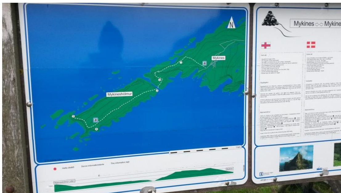
Mynd 2 Skelti við kunning til ferðafólk í Mykinesi

Í Mykinesi er eitt skelti, ætlað ferðafólki, sett upp omanfyri landingina, á veg móti bygdini, sum m.a. kannar um gøtuna út í Hólm, sí mynd 2. Eingi onnur skelti eru, sum t.d. lætta um at finna gøtuna.