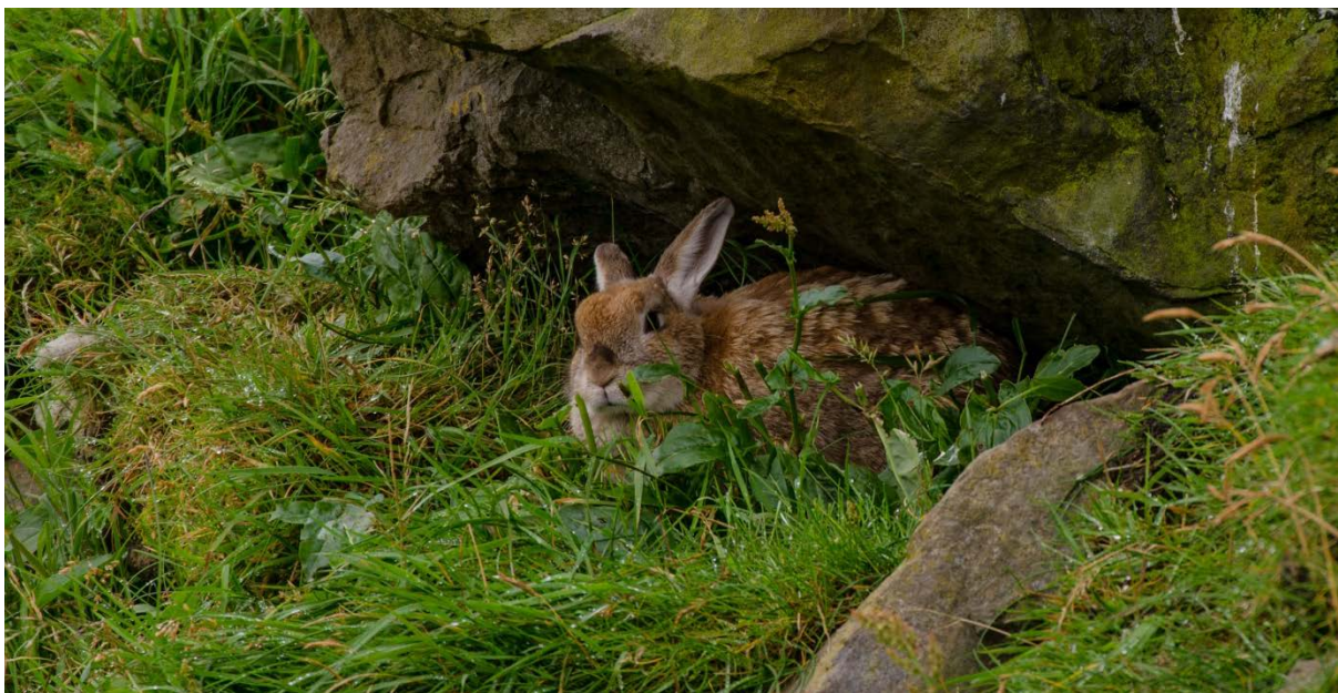
MYND 6. EIN KANIN HELT TIL Í LUNDALANDINUM.

Ein mús sást í einari av kannaðu holunum og ein kanin sást í holum í Dalinum.