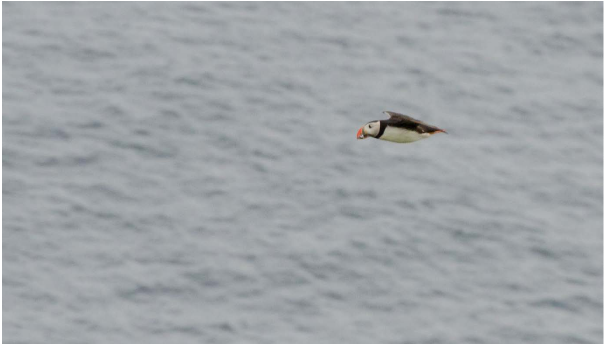
MYND 5. ONKUR EINSTAKUR SILDBERI VAR AT SÍGGJA Í 2013.

Hværki í 2011, 2012 ella 2013 vórðu livandi pisur sæddar í holum, sum vórðu kannaðar. Tað merkir, at hóast onkur pisa varð floygd, so hefur talið í mesta lagið verið nakrar hundrað.