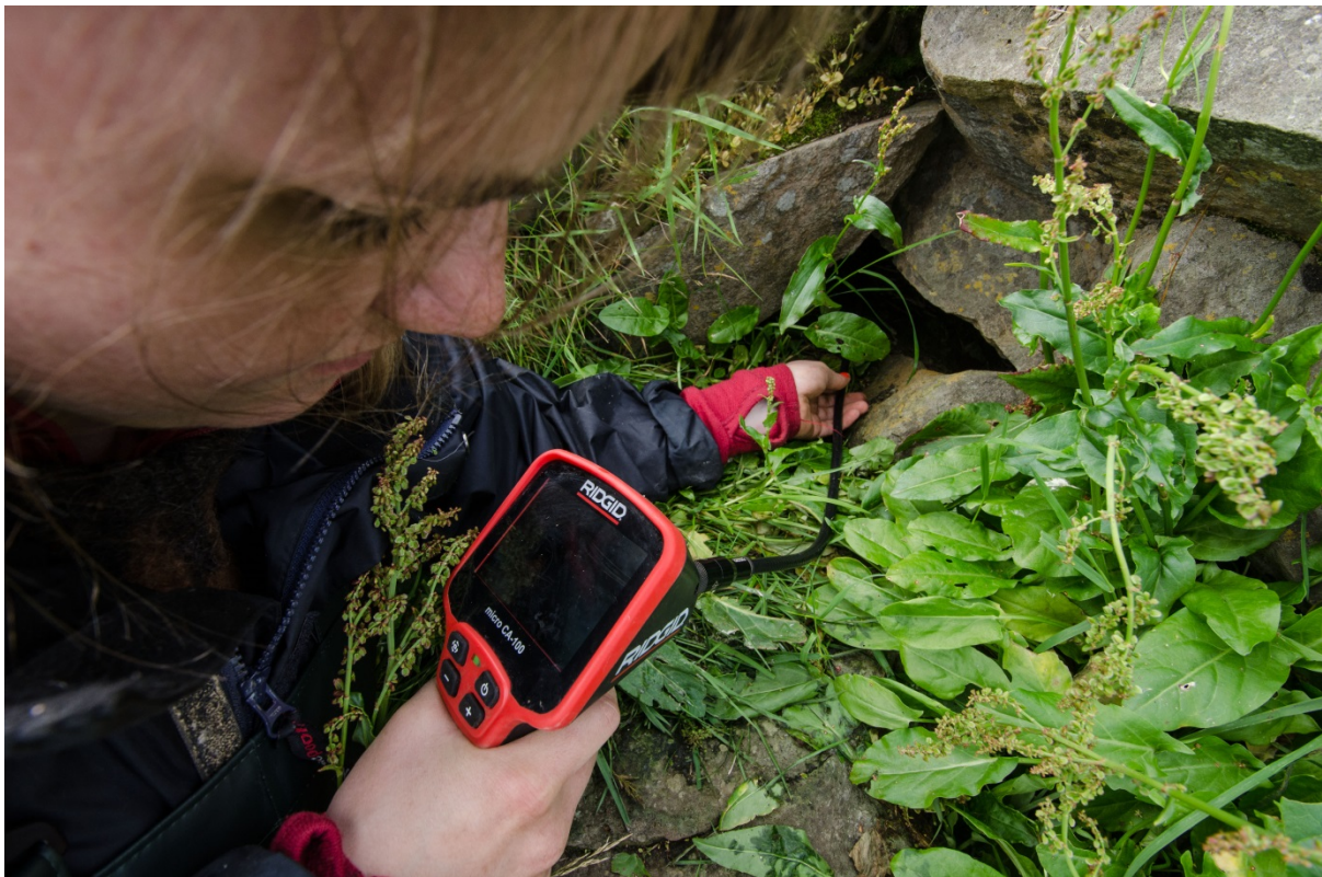
MYND 4. HOLUR, IÐ VÓRÐU BRÚKTAR, VÓRÐU KANNAÐAR VIÐ ENDOSKOPI.

Í 2011 fóru umleið 1/3 av holunum brúktar. Í 2012 og 2013 fóru tað umleið 2/3. Hóast samlaða talið av pisum hevur verið sera lágt, so hevur onkur verið, tí einstakir silbberar sóust á flogi.