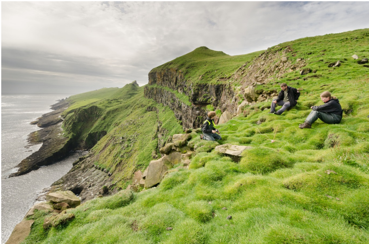
MYND 3. Í 2013 VÓRÐU HOLUR Í DALINUM OG LAMBA KANNAÐAR.

Í ár var mannagongdin nakað broytt, í mun til undanfarin ár. Higartil hava heilt fá økir verið kannað hvørt ár (fýra í 2011 og fimm í 2012). Hesi økir hava verið lutfallsliga stór (30 m 2 ). Í ár vóru økini minni (10 m 2 ) og talið av teimum var 27, tó í onkrum teirra var als eingin hola.